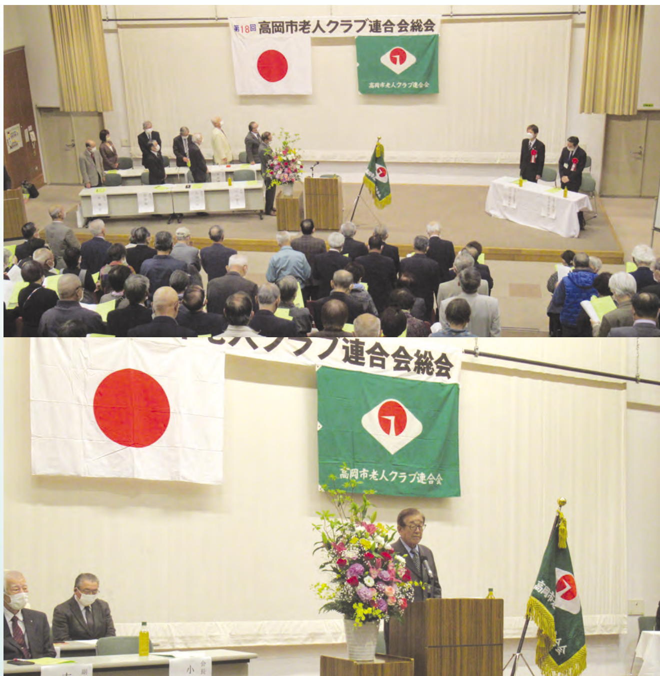
令和5年度定期総会の様子

高岡市博労本町4番1号 TEL (23) 7900 Eメール sirouren@aroma.ocn.ne.jp ホームページ http://takaoka-rouren.jp