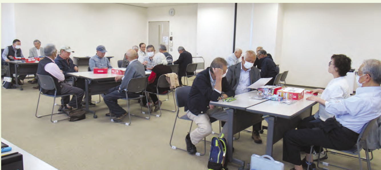
eスポーツ機材の説明会 (令和6年5月10日) ふれあい福祉センター