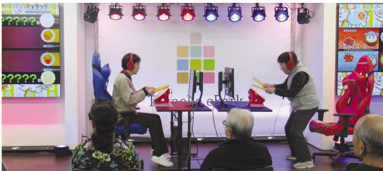
第2回 eスポーツ大会 (令和5年12月15日) Takaoka ePark