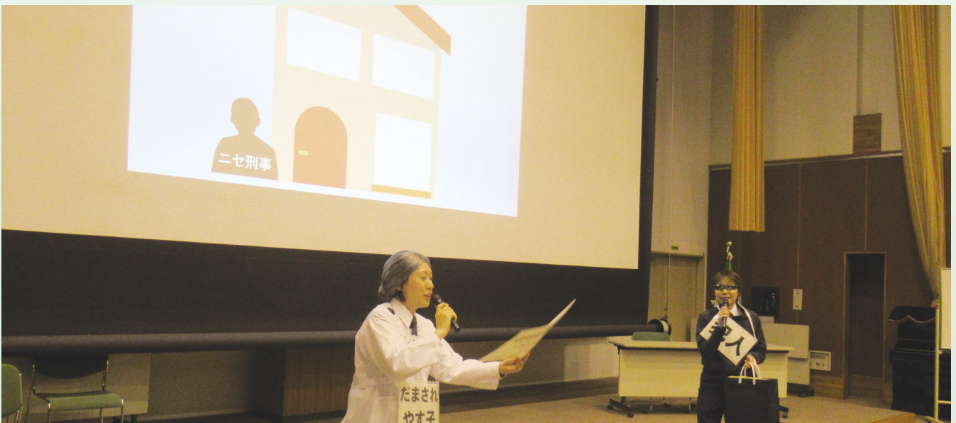
特殊詐欺被害防止教室 高岡警察署 生活安全課