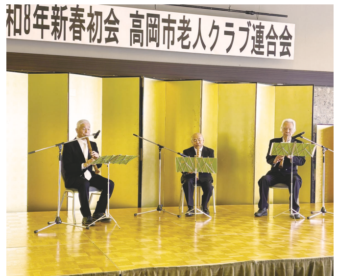
第2ブロック 定塚地区 老人クラブ 「壺越の会」の皆様による 尺八演奏を披露して頂きました