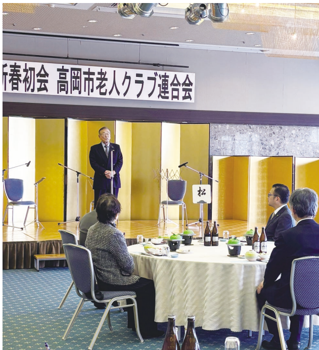
高岡市老連 小山会長よりごあいさつ