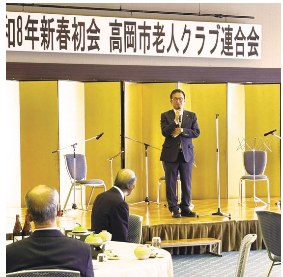
高岡市長 出町 讓様よりごあいさつ